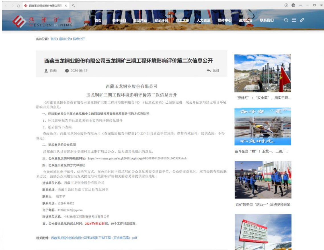
图 3-1 征求意见稿公示网络截图