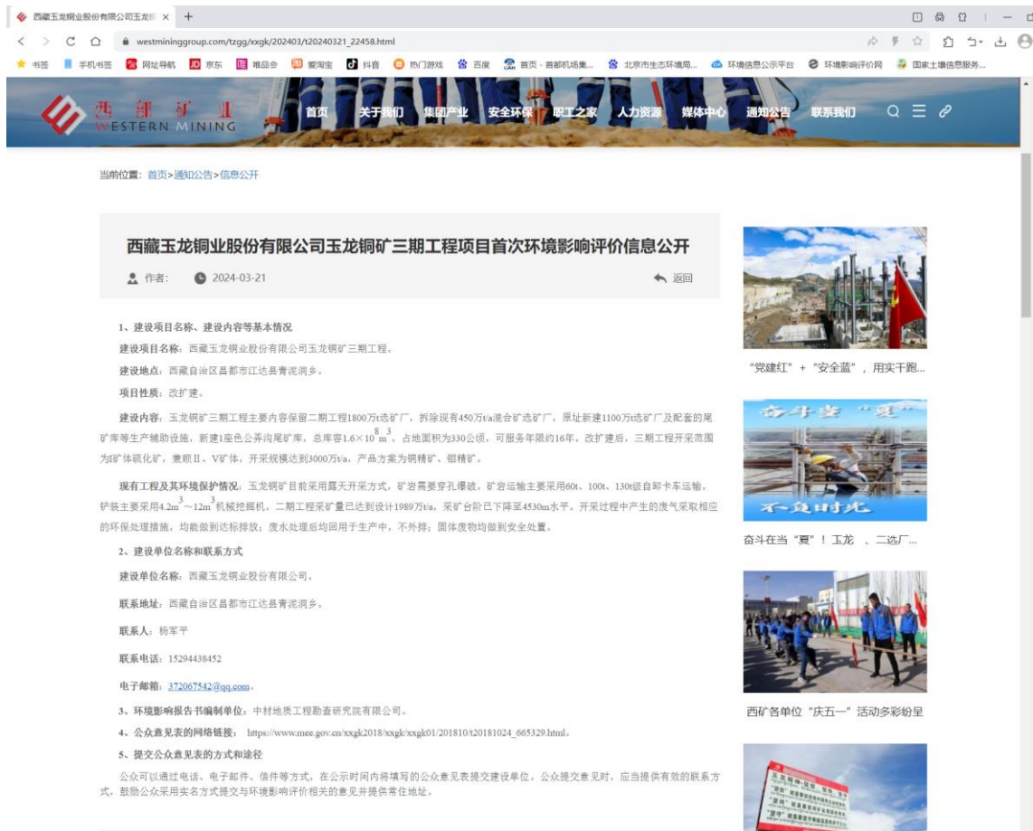
图 2-1 首次信息公开网络截图