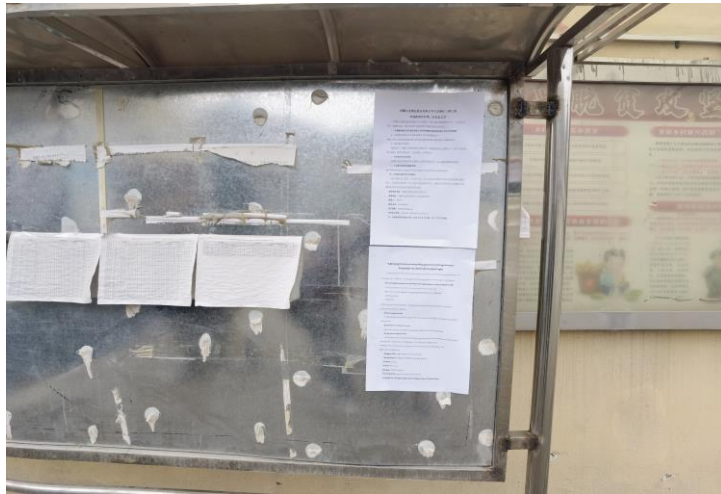
西藏江达县青泥洞乡觉拥村卫生室